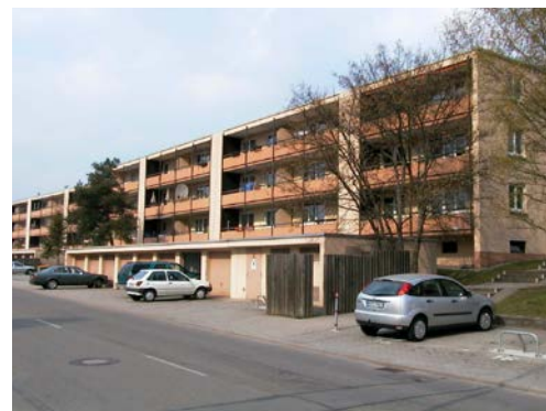
ERMELESSTRASSE 48-72 | Hechingen

Nach der Gründung im Jahr 1949 hat die Kreisbau zahlreiche Gebäude für ihre Mitglieder errichtet. Besonders in den 1970er-Jahren kamen etliche Wohnanlagen hinzu, die noch heute im Bestand der Kreisbau sind. Viele dieser Gebäude wurden in der Zwischenzeit umfassend saniert und modernisiert.