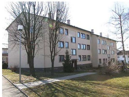
KÖNIGSBERGERSTRASSE 8-22 | Bisingen