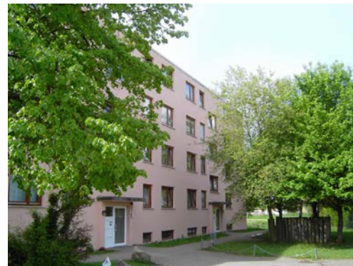
KÖNIGSBERGERSTRASSE 17-17/3 | Bisingen