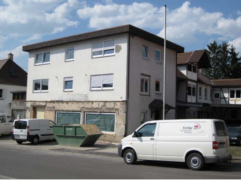
UMBAU HOFGARTENSTRASSE 27 | Hechingen Einzug in die neue Geschäftsstelle