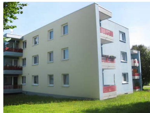
AM ROSENRAIN 4+6 | Rangendingen