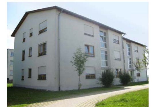
STAUFFENBERGSTRASSE 65-71 | Hechingen