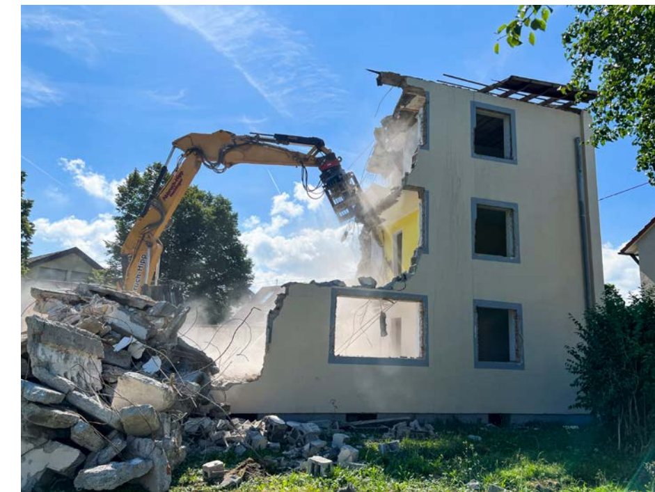
RÜCKBAU SILBERBURGSTRASSE 2 | Hechingen Hier sollen 12 neue Wohnungen entstehen