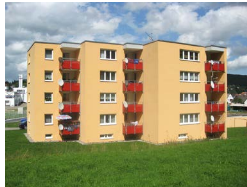
IM LAUEN 35 | Burladingen