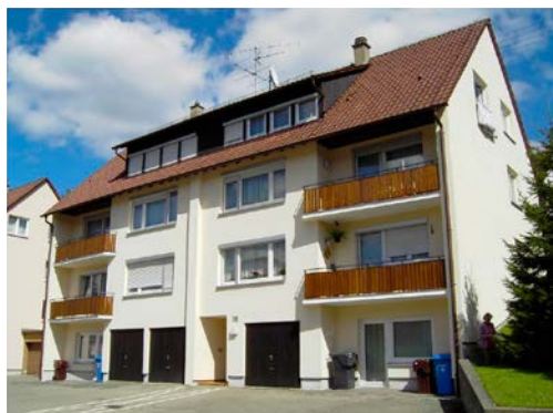
BLUMENSTETTERSTRASSE 88-90 | Burladingen