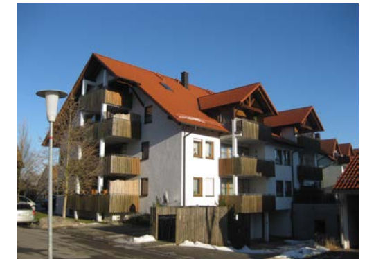
CARL-BAUR-WEG 3 | Hechingen