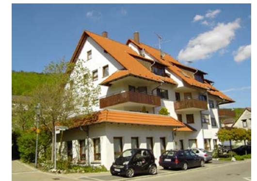
RICHARD-BIENER STRASSE 1-3 | Burladingen