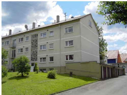
FÜRSTIN-EUGENIE-STRASSE 44+66 | Hechingen