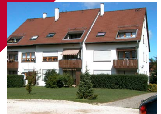
ZOLLERSTRASSE 7 | Bisingen

Nach der Gründung im Jahr 1949 hat die Kreisbau zahlreiche Gebäude für ihre Mitglieder errichtet. Besonders in den 1970er-Jahren kamen etliche Wohnanlagen hinzu, die noch heute im Bestand der Kreisbau sind. Viele dieser Gebäude wurden in der Zwischenzeit umfassend saniert und modernisiert.