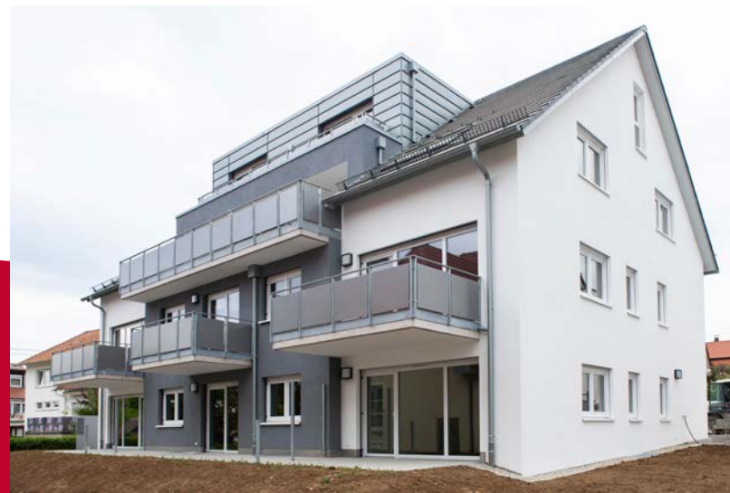
NEUBAU UNTERE KOPPENHALDE 4 | Bisingen Errichtung von 8 modernen Wohnungen