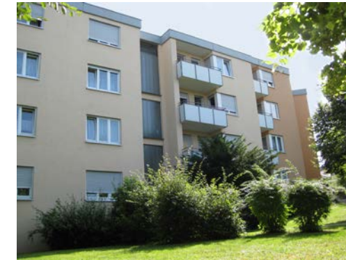
SCHALKSBURGSTRASSE 6+8 | Hechingen