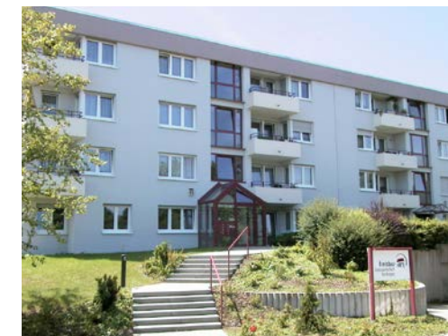
SCHALKSBURGSTRASSE 10+12 | Hechingen